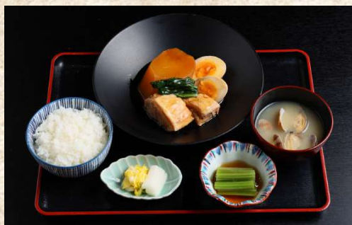
三元豚の角煮御膳 ¥1,000