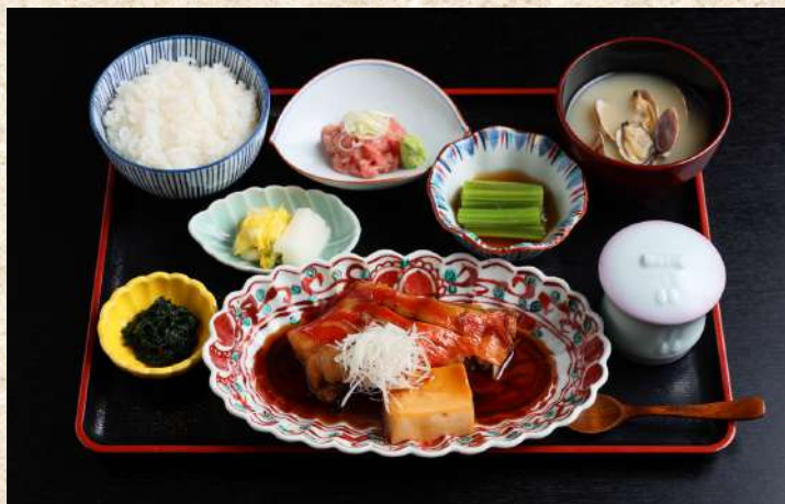
特撰 煮魚膳 ¥1,200